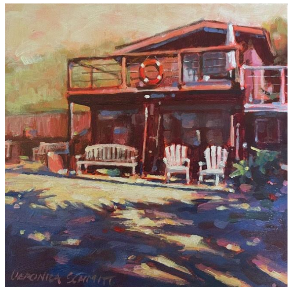
Salvavidas, acrílico sobre madera