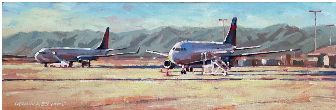
Aves Descansando, acrílico sobre lienzo